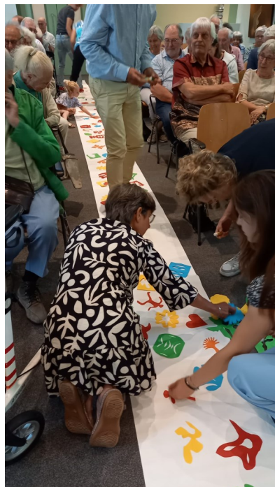
Hier nog een paar foto's van een vakantie dienst.