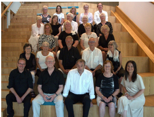
En nog een van het koor.